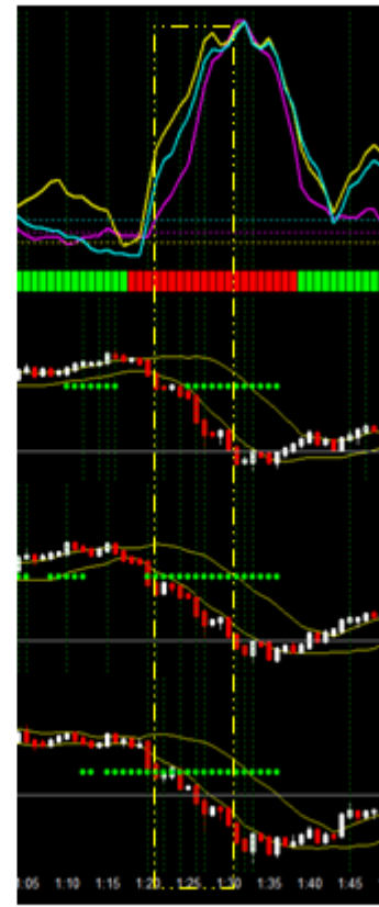
バイナリー1分足 7月22日1:20