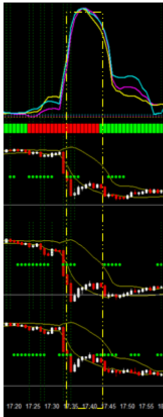
バイナリー1分足 7月21日17:30

凄いですね。バイナリーで5万円・FXで7万円の収益でした。素直に嬉しいです。 勝ちパターンは、これで良いのでしょうか。いつも勝ちパターンをスクラップしています。 3本のラインが揃って上昇した所だけのトレードでテクニックは全く必要無いのですね。 本当にこんなシンプルで良いのでしょうか。初心者にとりし穴は無いのでしょうか。