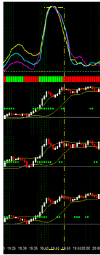
バイナリー1分足 7月21日19:35