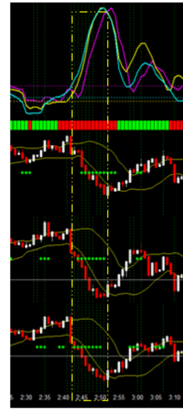
バイナリー1分足 7月22日2:45